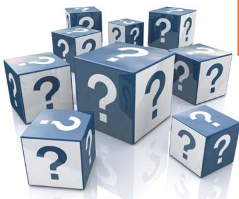
Terminator3D - Terminator3D